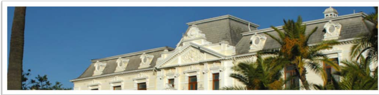
Kweekskoolgebou op Stellenbosch