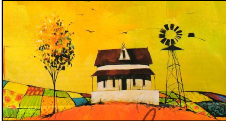
[Almanak mond- en voetskilders]