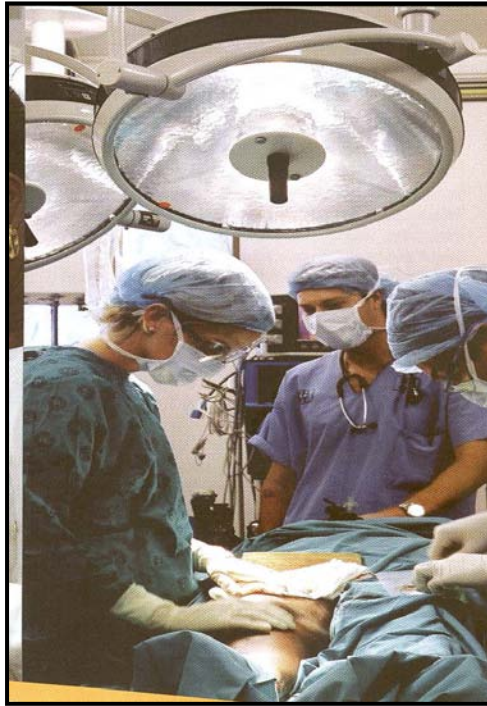
[Uit: Suid-Afrikaanse Jaarboek , 2008/09]