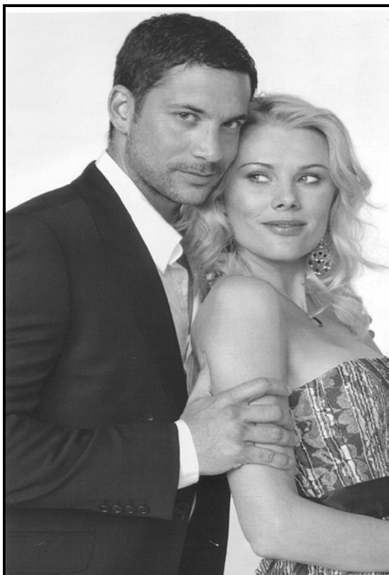
[Uit: Rooi Rose , September 2007]

Jy het onlangs die geleentheid gehad om die Matriekafskeid saam met die ou/meisie van jou drome by te woon. Skryf oor dié geleentheid in jou DAGBOEK .