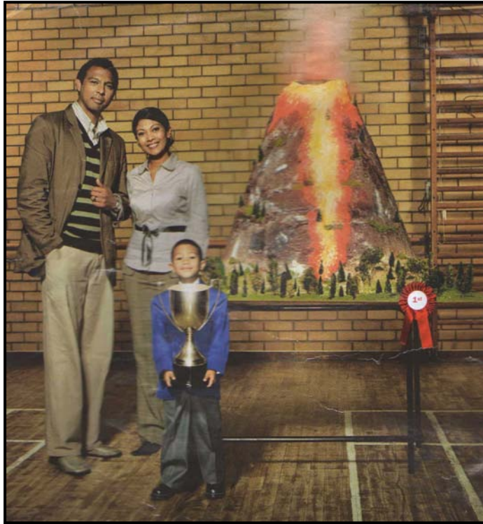
[Uit: Car , November 2007]