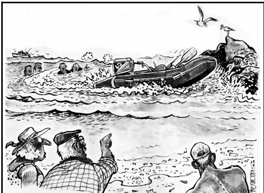
[Uit: WegSleep, Nov.-Des. 2008]