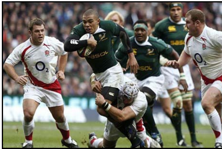
[Uit: Clipart: Bryan Habana]

Jy het 'n sportheld. Hy/sy is 'n groot inspirasie vir jou en jy wil graag in die lewe bereik wat hy/sy al bereik het. Sy/haar harde werk is vir jou 'n voorbeeld wat jy graag wil volg.