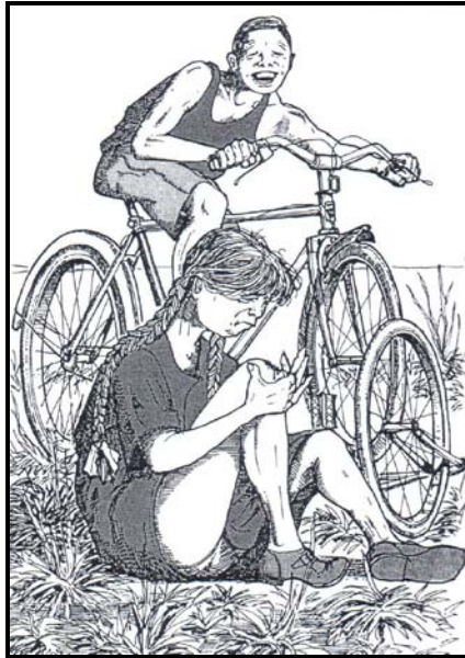
[Uit: Afrikaans vir die Sekondêre Skool St. 10]