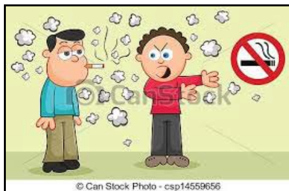
[Uit: Clipart Images:Vector - Cartoon Cigarette Smoker]