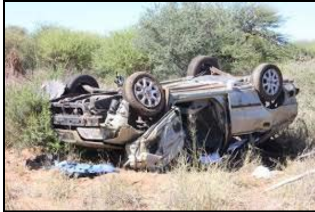
[Uit: https://www.google.co.za ]