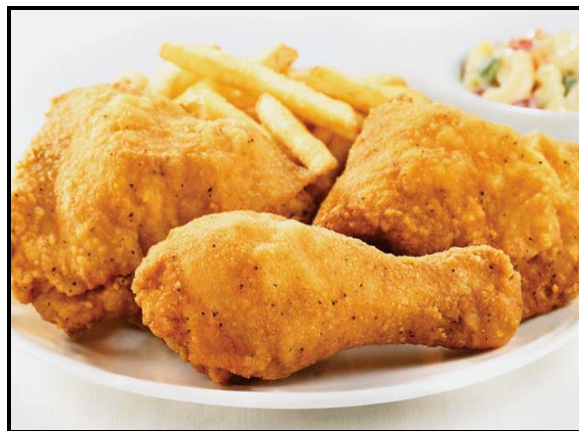
[Uit: http://www.hotcanadadeals ]