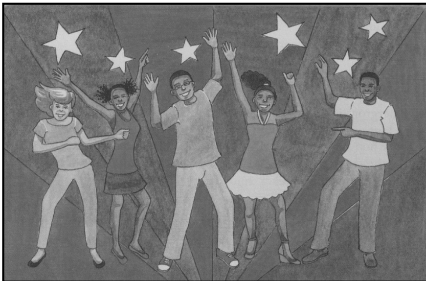
[Afrikaans is lekker]