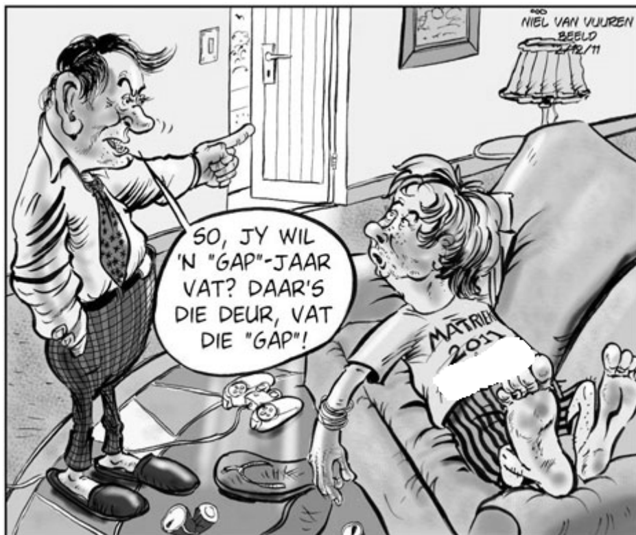
[UIT: Beeld , Desember 2011]

1.16 Lees weer reël 24 – 25. Is Cathryn Treasure se stelling oor programinhoud 'n FEIT of 'n MENING? Motiveer jou antwoord met verwysing na die teks. (2)