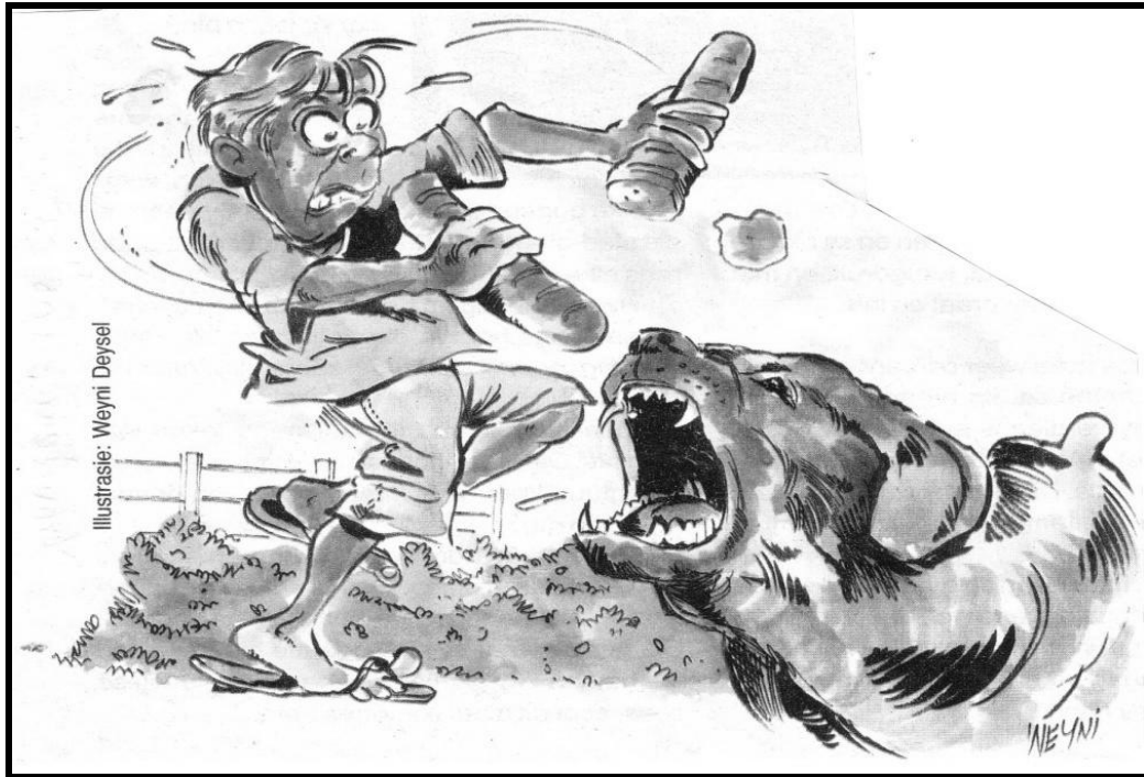
(Uit: Vrouekeur, 3 Junie 2009)