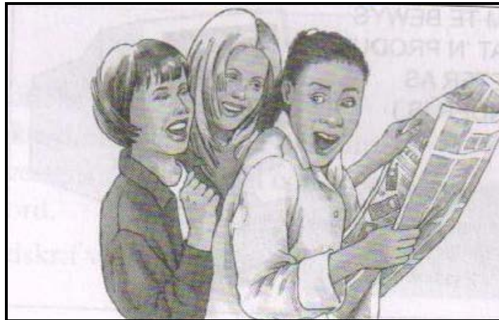
[Afrikaans is maklik]