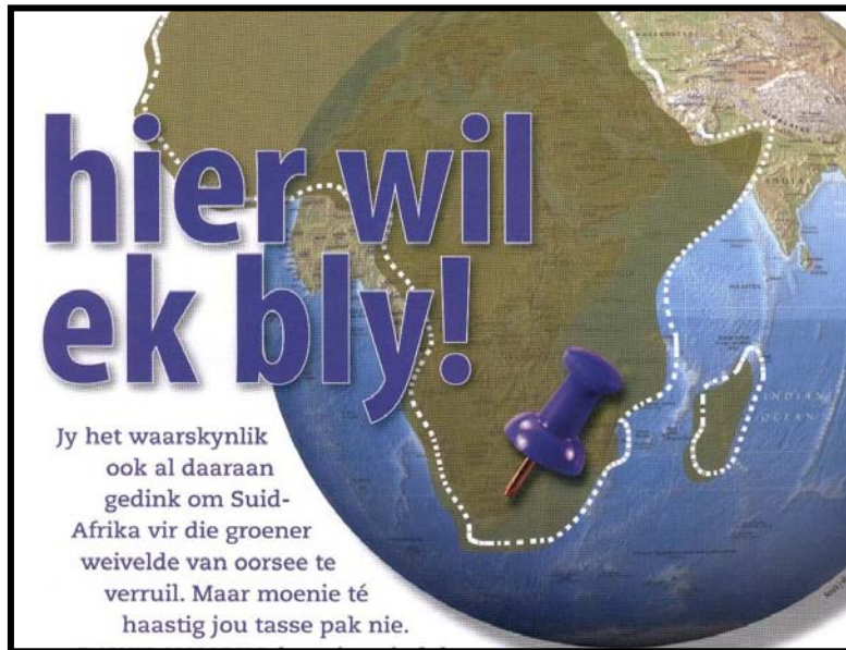
[Uit: Taalgenoot , September 2008]